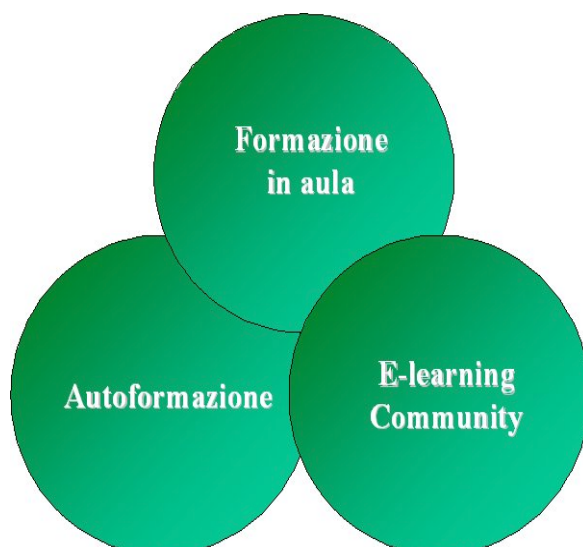
Il modello della formazione integrata